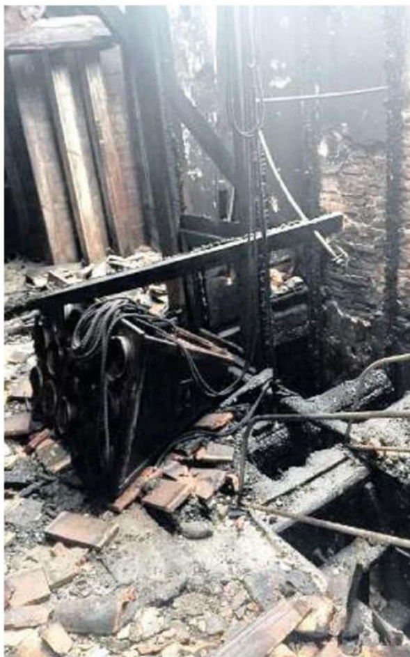
FRATTA POLESINE Ieri pomeriggio è tornato a rivivere il Mulino Pizzon che era stato devastato dall'incendio di 11 mesi fa