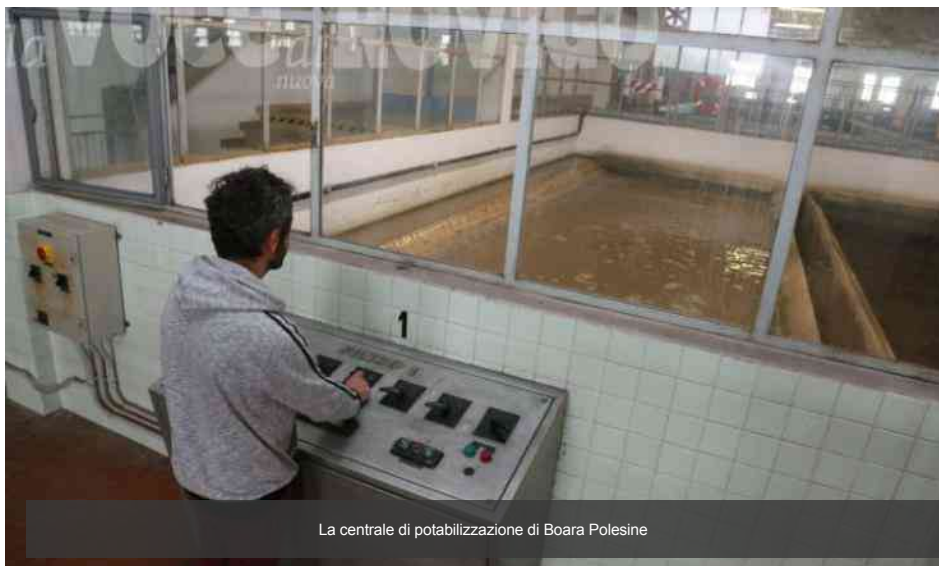
La centrale di potabilizzazione di Boara Polesine

Hanno preso l'avvio durante l'estate i lavori di adeguamento presso due delle centrali di potabilizzazione che attingono di fiume Adige, quella di Badia Polesine e quella di Cavarzere